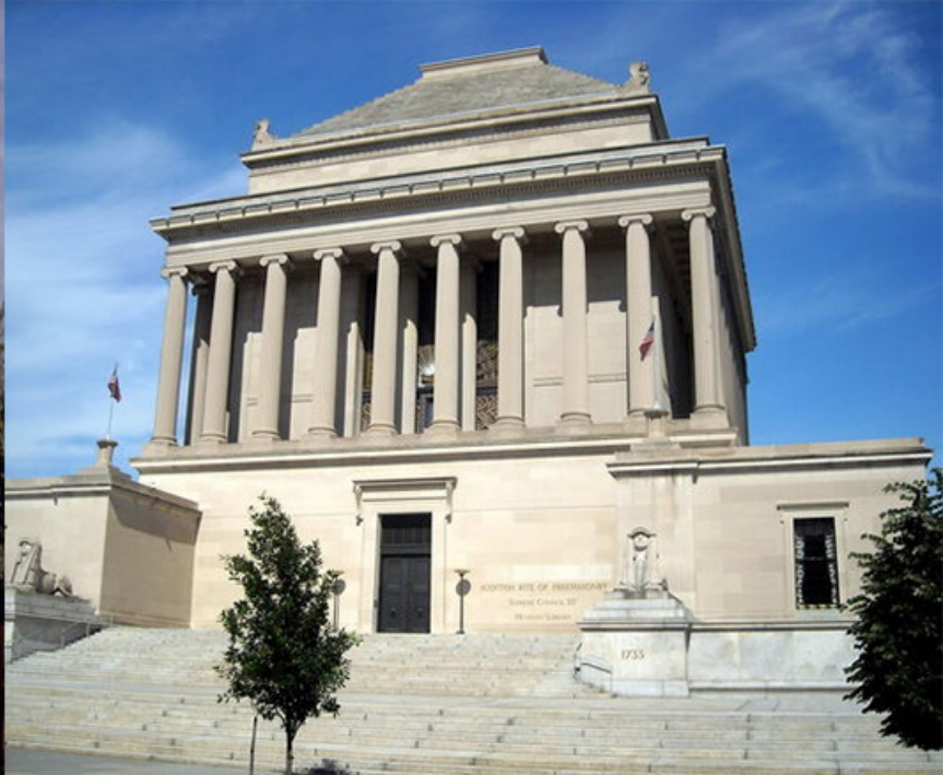
A "Shepherd's Tavern", local do nascimento do REAA e do Supremo Conselho Mãe do mundo, em 31 de maio de 1801, em Charleston. Ao lado, a imponente "House of the Temple", em Whashington D.C., que foi a primeira biblioteca pública de Washington, D.C., abrigando um acervo de mais de 250 mil obras literárias maçônicas.

destino lhes reservou, representam muitas das tantas curiosidades, entre os maçons.