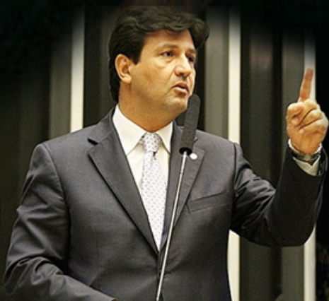
Frente Parlamentar da Medicina Luiz Henrique Mandetta